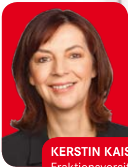
KERSTIN KAISER Fraktionsvorsitzende

Viel Arbeit liegt auf dem Geburtstagstisch der ersten rot-roten Koalition aus DIE LINKE und SPD in Brandenburg. Vor einem Jahr haben die beiden Fraktionen ihre Zusammenarbeit mit einem Vertrag besiegelt. Ein Glas ist gefüllt: das erste Fünftel der Wahlperiode bis 2014 haben wir geleistet. Doch viel Zeit zum Feiern ist nicht. „Gemeinsinn und Erneuerung. Ein Brandenburg für alle.“ hat sich Rot-Rot auf das Banner geschrieben: das anspruchsvolle Ziel wollen wir mit Ihnen, mit Euch erreichen. Doch ein kurzer Rückblick sollte sein. Trotz großer Herausforderungen, trotz starkem Gegenwind und trotz eigener Unzulänglichkeiten – die rot-rote Koalition ist stabil und sogar gestärkt. Ihr Ansehen wächst. Eine Studie der Meinungsforscher von „infratest“ zeigte gerade erst: