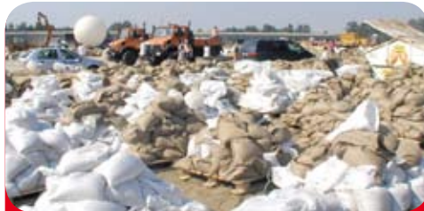
Die Bilder scheinen immer wiederzukehren: Berge von Sandsäcken, dazwischen schweres Gerät, um gegen die Hochwasser-Fluten anzukämpfen

Extreme Niederschläge haben in diesem Jahr dazu geführt, dass sich an Oder, Neiße, Spree und Schwarzer Elster Hochwasserkatastrophen entwickelten. Und dazu kam noch das Binnenhochwasser an der Oder. Das macht deutlich: Hochwasserschutz und Hochwasser-Risiko-Management sind eine unverzichtbare Aufgabe zum Schutz der Bevölkerung. Umweltministerin Anita Tack (DIE LINKE) ist bereits aktiv. Gegenwärtig bereiten wir dazu eine Kabinetttvorlage vor. Sie beschäftigt sich mit der weiteren Verbesserung des Hochwasserschutzes. Unser Ansatz ist, den Flüssen wieder mehr Raum zu geben. In einem Entschließungsantrag der Koalitionsfraktionen zum Hochwasser