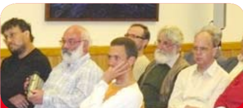
Haben für ehrlichen Dialog zwischen Politik und Bevölkerung offene Ohren: Besucherinnen und Besucher des finanzpolitischen Abends in Rathenow

Das ist oft nicht gerade gemütlich. Doch wir tun das, auch und gerade dann, wenn sich besorgter Widerstand von Betroffenen formiert: zum Beispiel der linke Wirtschaftsminister auf Ortsterminen, besonders beim Energiedialog wegen der umstrittenen Kohlendioxid-Verpressung (CCS) und den Protesten möglicher Betroffener dagegen. Übrigens: wir vertreten nicht nur die Themen „unserer“ MinisterInnen. Wir bekennen auch bei komplizierten Vorhaben der Gesamt-Regierung in den Wahlkreisen Farbe, siehe Polizei-Strukturreform. Wer von Gemeinsinn redet, muss ihn auch vorleben.